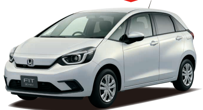
Photo:フィット e:HEV HOME (FF) ボディカラーはプレミアムサンライトホワイトパール(消光色:55,000円高) フィット e:HEV HOME 型式:6AA-GR3 1.5L 電気式無段変速機/FF